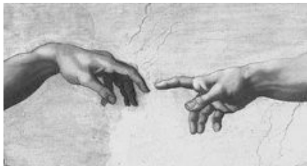
Guds hand ger människan liv. Michelangelo.

KHS är ett ekumeniskt forum för kristen belysning av frågor om tro, människovärde och samhällsdebatt. Vill du lära känna KHS? Köp "Ordet är fritt?", vår årsbok från 2007 med artiklar och recensioner. Sätt in 190:- på KHS bankgiro 276-6327. Eller, än hellre, bli medlem! Avgiften är (helst) 300 kr, eller 175 för enskilda och 225 för familj.