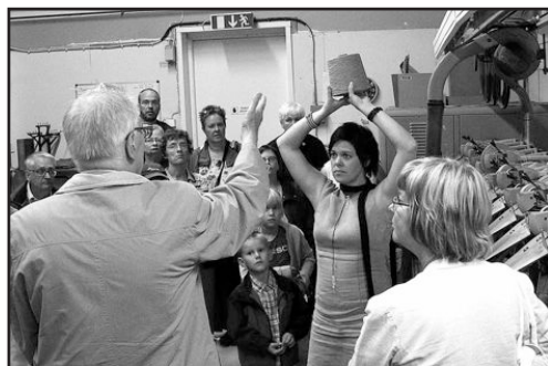
Sommarmöte 2007. Från besöket på Växbo Lin.