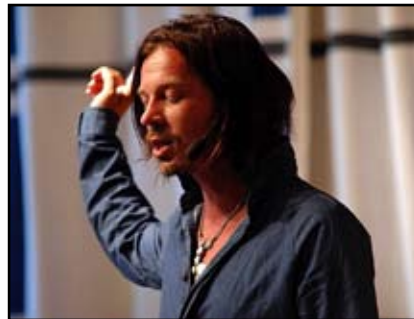
Sommarmöte 2009. Bob Hansson intar estraden.